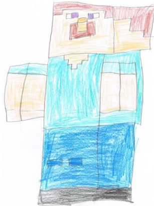
Iman und Wiebke (3a)

Minecraft ist ein cooles Spiel. Das kann man auf der Konsole oder auf dem Computer spielen. Da ist alles viereckig. Man kann das allein oder online spielen. Die Figuren sind Menschen oder Tiere und sie sind viereckig. Man kann dann alles bauen, was man will.